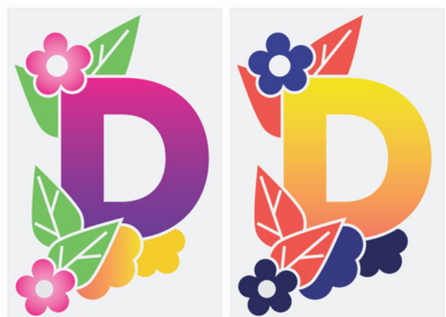
Odbitki na papierze