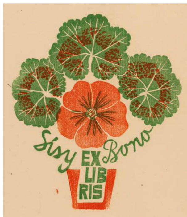
autor: Edward Grabowski